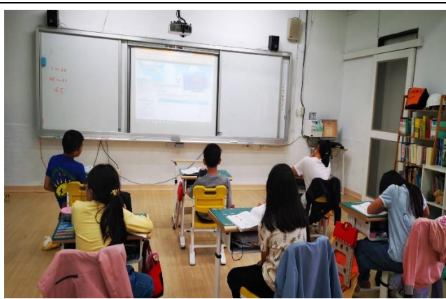
說明：開始利用平時作業查找的各國父親花的花語，將大家查詢資料彙整。