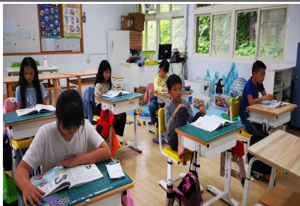
說明：從課文中找尋母親花的意義。