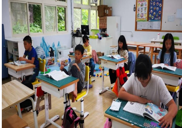
說明：各別發表自己的文章與老師的回饋。