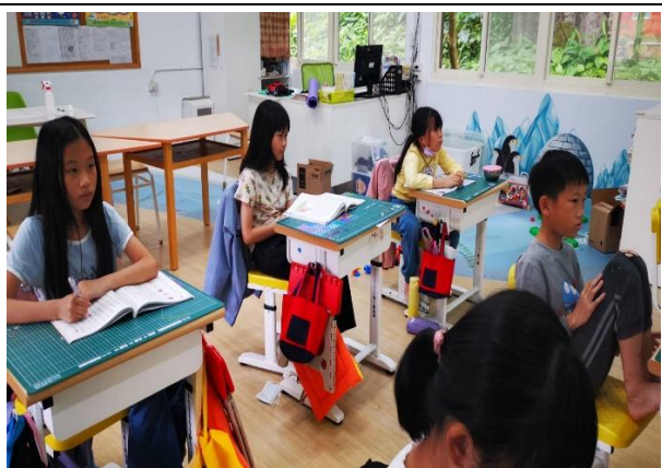
說明：開始效仿課文，寫作:不一樣的父親花。