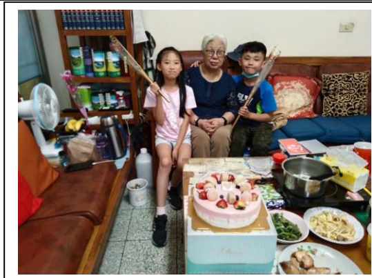
【課程活動六】感恩月系列活動