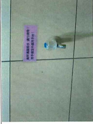
接引山泉水供廁所清洗打掃