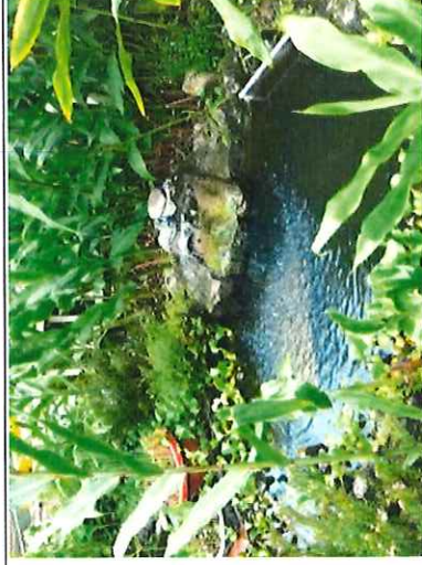
山泉水供生態池灌溉