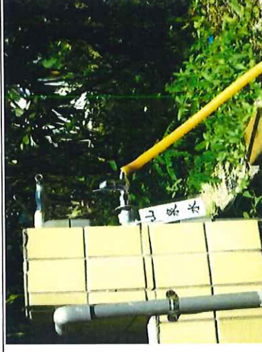
山泉水供校園綠美化、學生清洗打掃