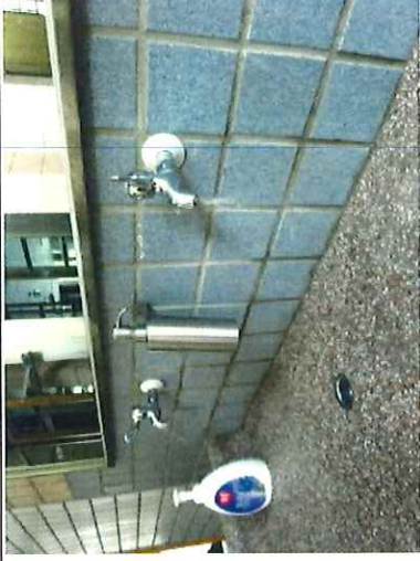
洗手台設置省水龍頭