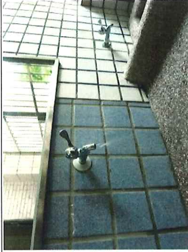
洗手台設置省水龍頭