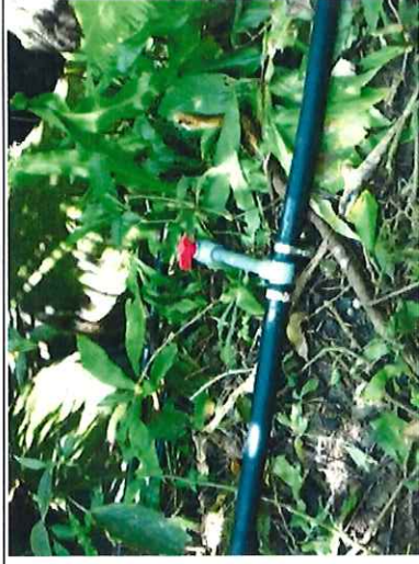
接引山泉水儲水塔