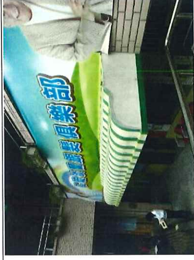
外牆鋼架遮陽、美化