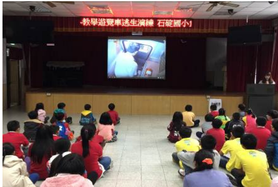
照片說明：校外教學活動出發前遊覽車設備說明